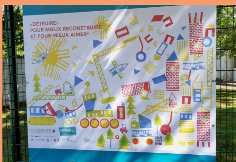
Fresque de l'école maternelle des Gibjoncs