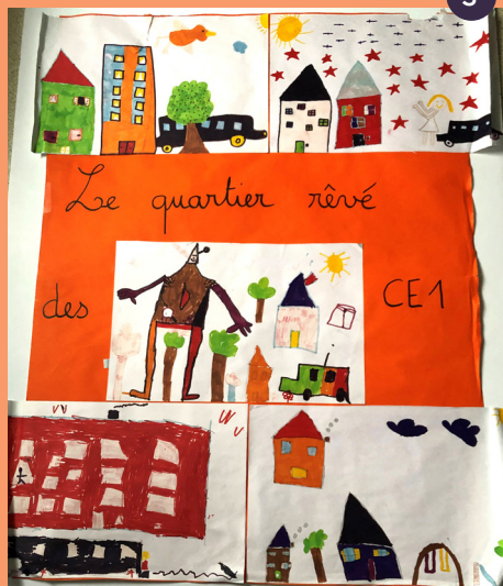
Dessin de l'école élémentaire du Grand Meaulnes

• La Gestion Urbaine et sociale de proximité (GUSP) est une démarche partenariale intégrée dans le volet cadre de vie et renouvellement urbain du contrat de ville de Bourges pilotée par la communauté d'Agglomération de Bourges Plus. Elle a pour but d'améliorer la qualité résidentielle dans les quartiers prioritaires de la ville de Bourges. Elle réunit les Services de la Ville de l'Agglomération, les bailleurs sociaux SA HLM France Loire, Val de Berry OPH du Cher, des Conseils Citoyens, des associations, le Centre social. Dans le cadre du NPNRU, la GUSP a pour objectif d'accompagner les habitants et les usagers sur les différentes étapes de transformation du quartier, permettre l'appropriation des nouveaux espaces et des lieux libérés par les démolitions en attente de projet. Elle veillera à ce que la continuité des services pendant les travaux soit assurée (circulation, stationnement, gestion des déchets, éclairage, entretien, sécurité, lien social, animations...), limiter la gêne au quotidien et donc anticiper les nuisances. Les problématiques sont relevées lors des diagnostics en marchant, de visites régulières sur site sur le quartier, de remontées d'habitants (maison du projet) et de groupe de travail avec les partenaires. Des réponses techniques et de prévention seront apportées.