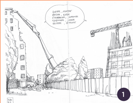
Croquis de Nathalie Ledey

• « Comment les habitants vont-ils être associés sur la transformation du quartier ? »